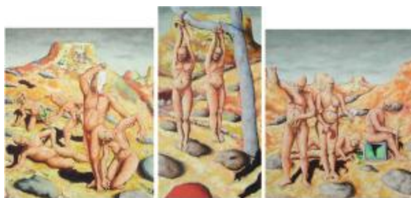
Típico "A busca do água". Óleo sobre tela, 2006. Lateral: 133 x 154 cm. Central: 198 x 99 cm.