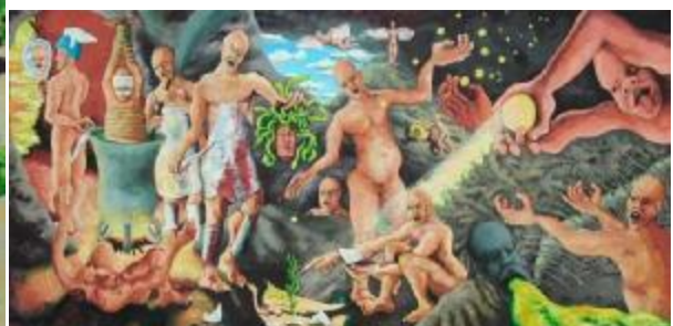
"A Medusa ou o desespero vita cotidiano". Óleo sobre tela, 2006. 158 x 329 cm.