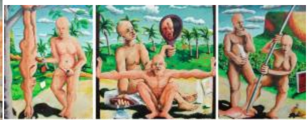
Típico "Pesquisador". Óleo sobre tela, 2006. Lateral: 139 x 77 cm. Central: 139 x 139 cm.