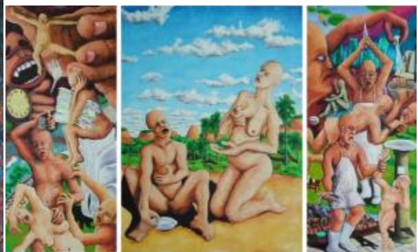
Típico "So político é uma possibilidade mas não paz". Óleo sobre tela, 2006. Lateral: 207 x 92 cm. Central: 207 x 148 cm.