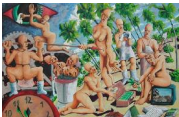
"Condenado!". Óleo sobre tela, 2006. 154 x 235 cm.